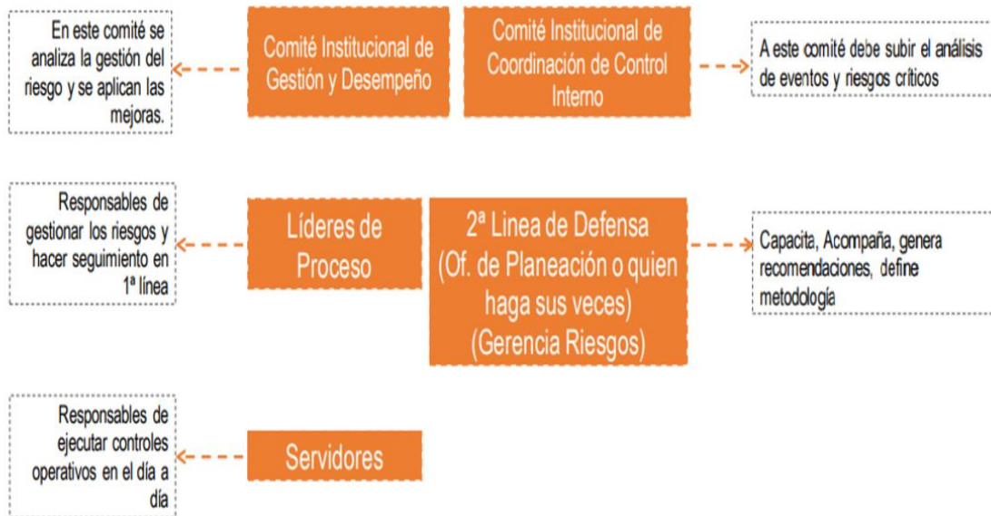
Figura 1. Operatividad Institucionalidad para la Administración del Riesgo